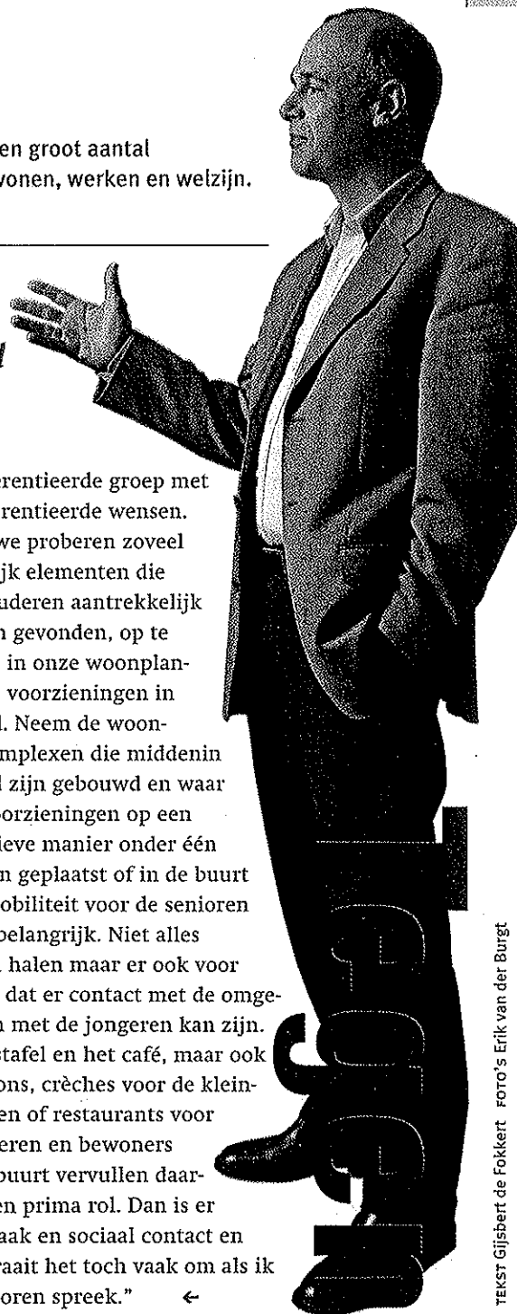
TEKST Gijssbert de Fokkert

gedifferentieerde groep met gedifferentieerde wensen. Laten we proberen zoveel mogelijk elementen die door ouderen aantrekkelijk worden gevonden, op te nemen in onze woonplannen en voorzieningen in de stad. Neem de woonzorgcomplexen die middenin de stad zijn gebouwd en waar veel voorzieningen op een inventieve manier onder één dak zijn geplaatst of in de buurt zijn. Mobiliteit voor de senioren is wel belangrijk. Niet alles binnen halen maar er ook voor zorgen dat er contact met de omgeving en met de jongeren kan zijn. De leestafel en het café, maar ook kapsalons, crèches voor de kleinkinderen of restaurants voor de ouderen en bewoners uit de buurt vervullen daarvoor een prima rol. Dan is er aanspraak en sociaal contact en daar draait het toch vaak om als ik de senioren spreek.” ←