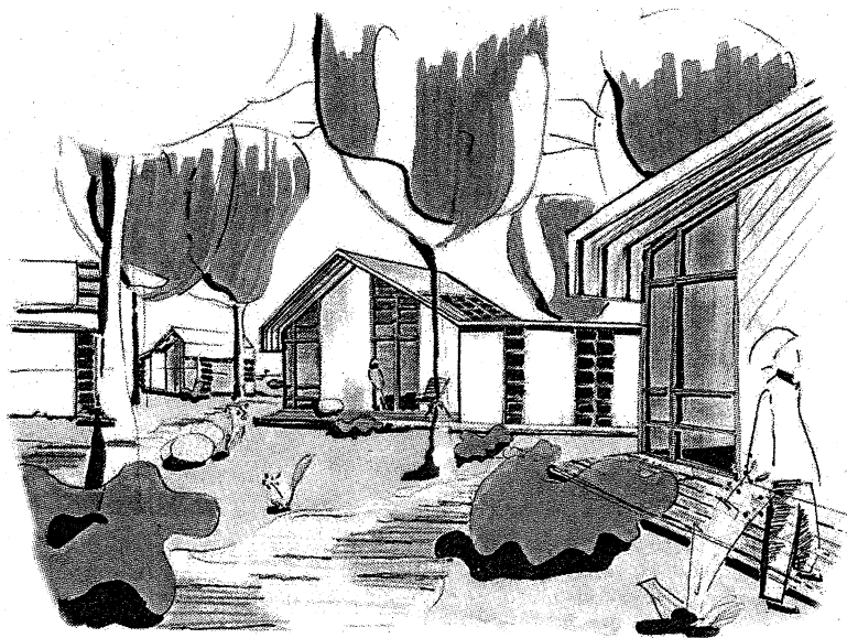
...wonen in het bos...

Herfstkleuren en najaarszon blijven fotografen inspireren.