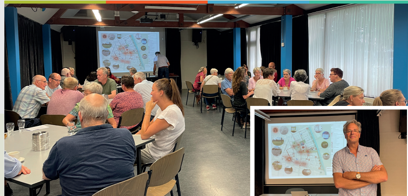
De bewonersbijeenkomst in wijkhuis De Lier