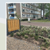
Openbare ruimtes samen aangepakt